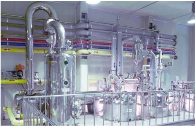
진공농축설비 / 真空浓缩设备 (Concentrate Plant)