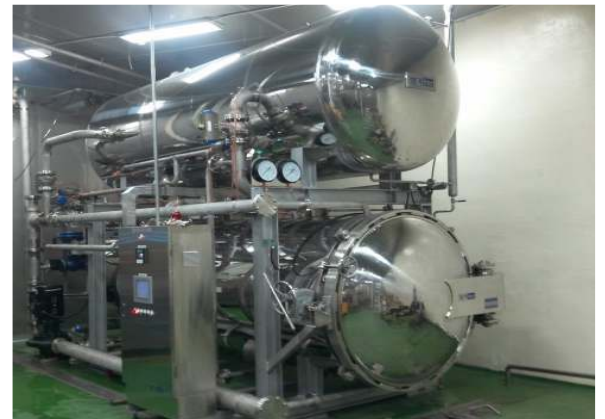
고압살균기 / 高压杀菌机(Hi-Retort)