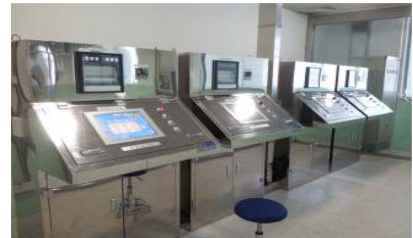
증삼기자동제어실 / 蒸参机自动控制室 (Steamer Control System)