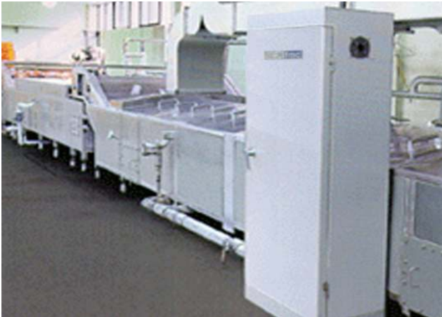
저온살균기 / 低温杀菌机(Pasteurizer)