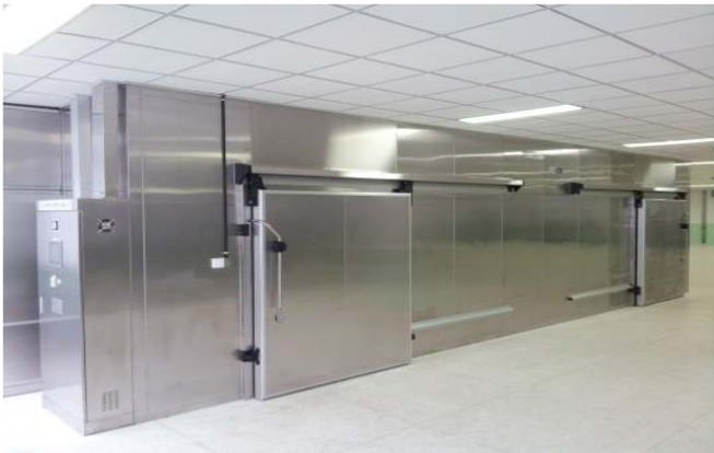
냉풍건조기 / 冷风干燥机(Cold Blast Dryer)