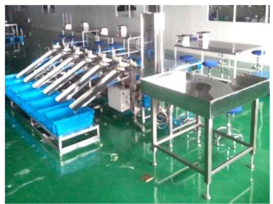
중량선별기 / 拣选机(Weight Checker)