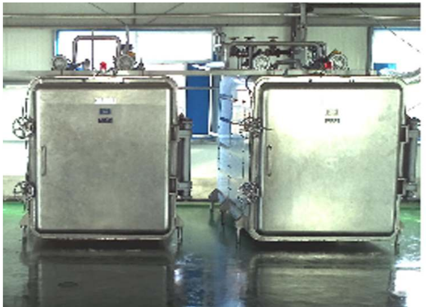
증삼기 / 蒸参机(Ginseng Steamer)