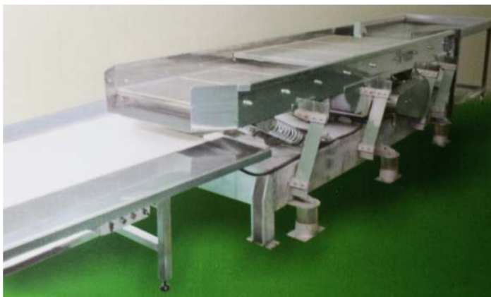
치미기 / 治尾机(Vibrator)