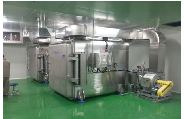
제품건조기 / 制品干燥机(Final Dryer)