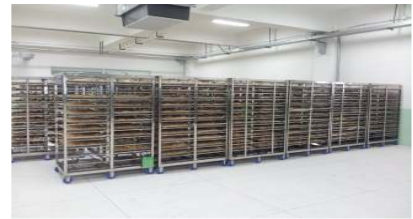
대차 / 推车(Loading Car)