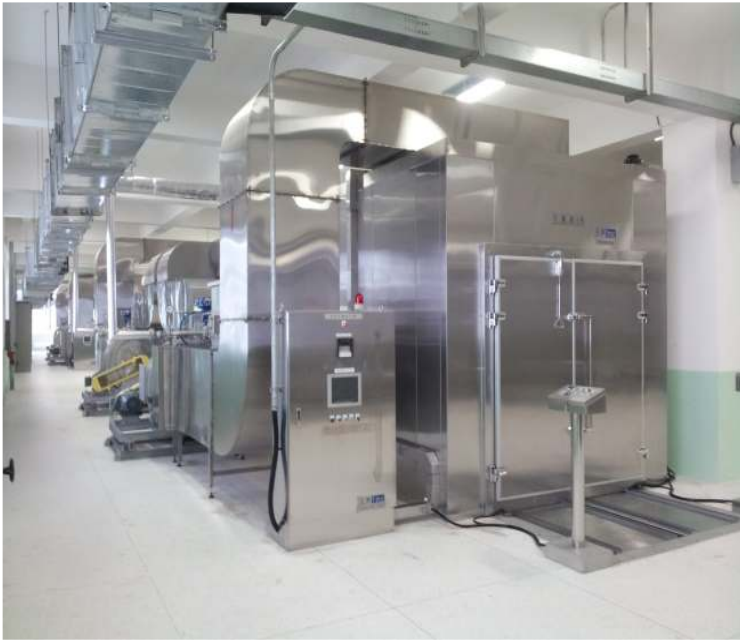
열풍건조기 / 热风干燥机(Auto Dryer)